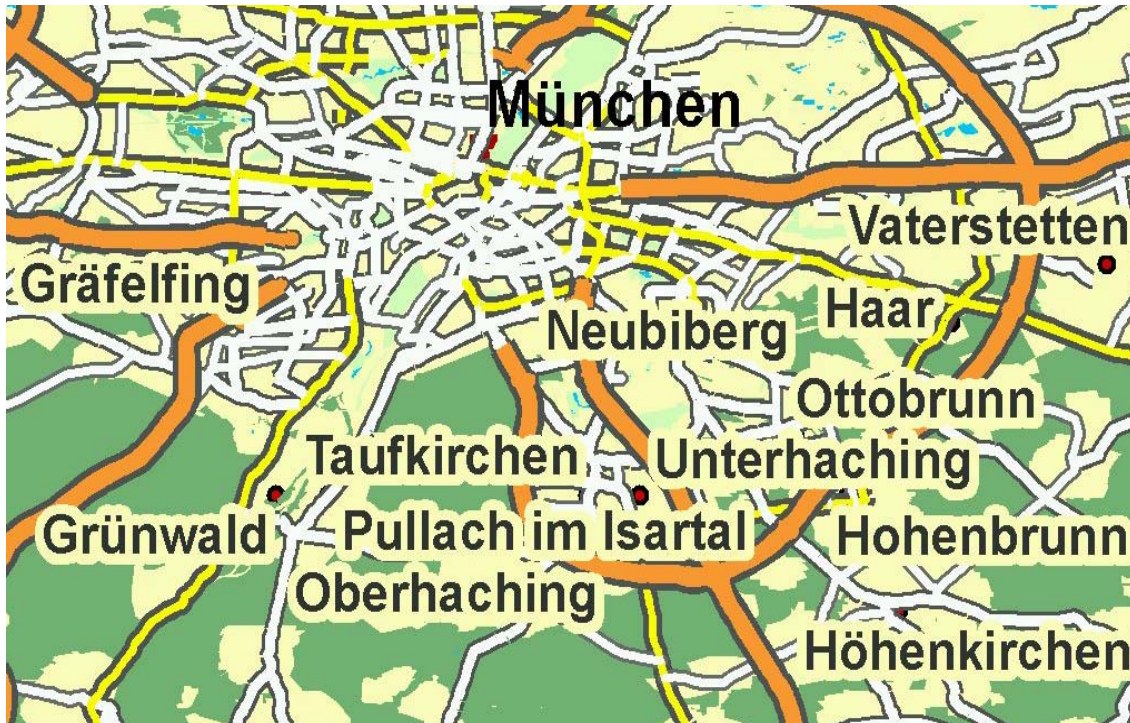
Abbildung 3: Mit Referenzmaßstab