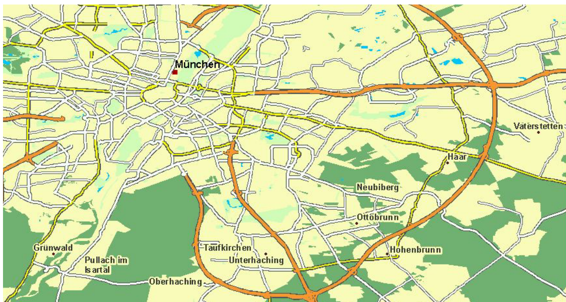
Abbildung 4: Ohne gesetzten Referenzmaßstab