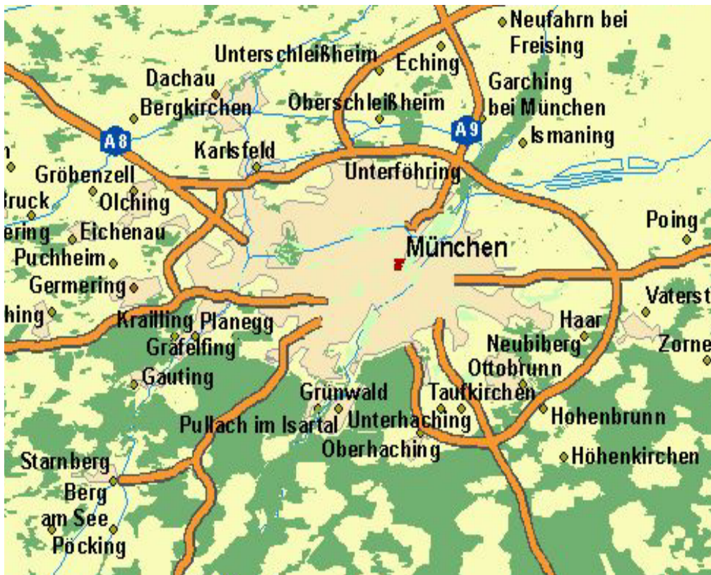
Abbildung 2: München 1:500.000

Als erstes muss ich mich entscheiden, ob ein Referenzmaßstab gesetzt werden sollte oder nicht. Aufgrund der gewünschten Dynamik des Kartenmaßstabes entschließe ich mich keinen Referenzmaßstab zu setzen, so dass alle Darstellungen (Symbologie plus Beschriftung) mit ihrer definierten Größe unabhängig vom herrschenden Kartenmaßstab gezeichnet werden. Dadurch vermeide ich für bestimmte Maßstäbe Konflikte in der Symbolisierung, die das schnelle und einfache Erkennen der Karteninformationen erschweren würden. Abbildung 1 zeigt München und Umgebung bei einem Kartenmaßstab von 1:500.000 und gesetztem Referenzmaßstab von 1:500.000.